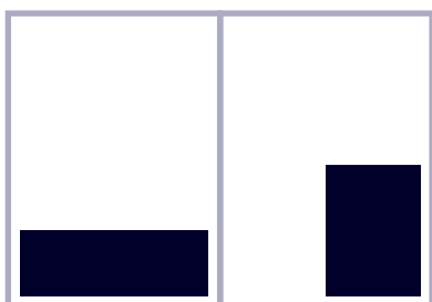
1/4 page L 182 x 56 mm 1/4 page H 88 x 122 mm