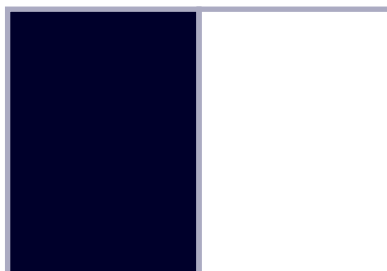
1 page 210 x 286 mm + 3mm bord perdu