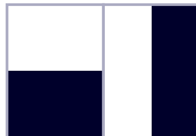
1/2 page L 210 x 136 mm + 3mm bord perdu 1/2 page H 102 x 286 mm + 3mm bord perdu